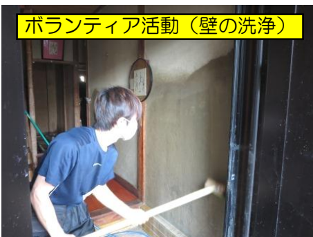
ボランティア活動(壁の洗浄)