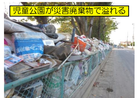
児童公園が災害廃棄物で溢れる

◎問合せ・申込み 豊田市社会福祉協議会 地域福祉課 電話:31-1294(日・月曜日、祝日休み)