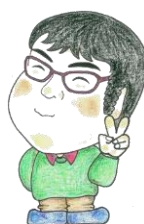
主査 水野 正也