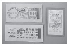
(注1)メータースタンプ