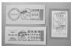
メータースタンプ