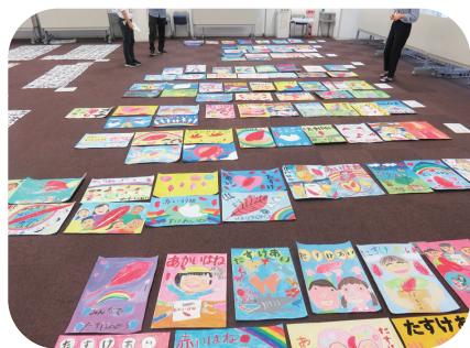
豊田市での審査会の様子