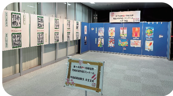
特賞作品の展示の様子