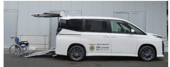
寄贈いただいた福祉車両(ヴォクシー)