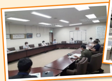
【左】企画検討（協議体）の様子 【右】多世代交流食堂の様子▶

誰もが役割をもって参加できる居場所づくりを目指して、令和4年4月から障がい事業所を中心に地域住民やボランティアの方々に、多世代交流食堂を開催しています。上郷出張所は、企画づくり、地域住民と関係機関で話し合う場の設定、ボランティア等への呼びかけなどの支援をしています。