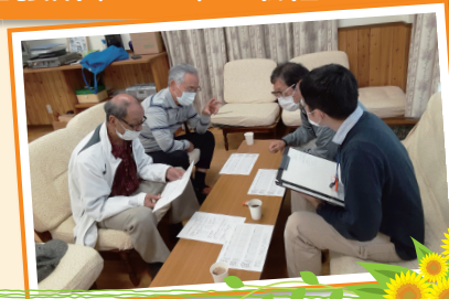
見守りの仕組みづくりの検討の様子▶

※CSWは社会福祉協議会の拠点（福祉センター、6支所、4出張所）に配置しています。連絡先は裏面に記載しています。