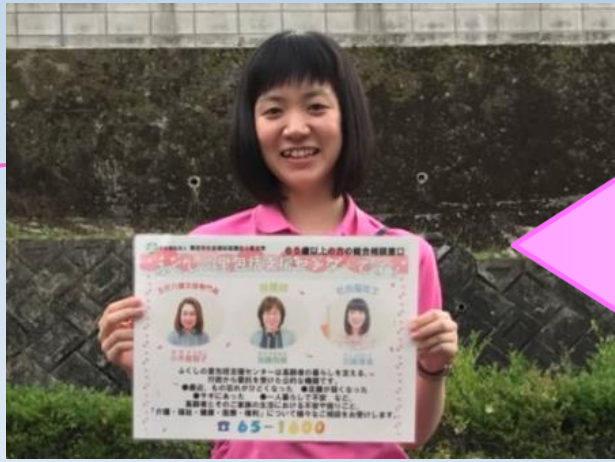
下山支所（平成29年度採用）

A 地域づくりを行えることと、社会福祉士の資格を活かせる地域包括支援センターで働きたいという思いがあったからです。もちろん、特別養護老人ホームや病院でも包括に勤務することはできますが、社協は、特別養護老人ホームや病院などに比べると、夜勤もなく、包括で活躍できる可能性が高い就職先と考え、希望しました。