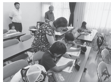
昨年度の学習支援の様子