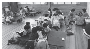
昨年度の子どもの様子

子ども食堂に関する相談窓口も設置しました。子ども食堂を立ち上げたい、ボランティアまたは寄付金や食材提供などで応援したい等の子ども食堂に関する相談がありましたらご連絡ください。