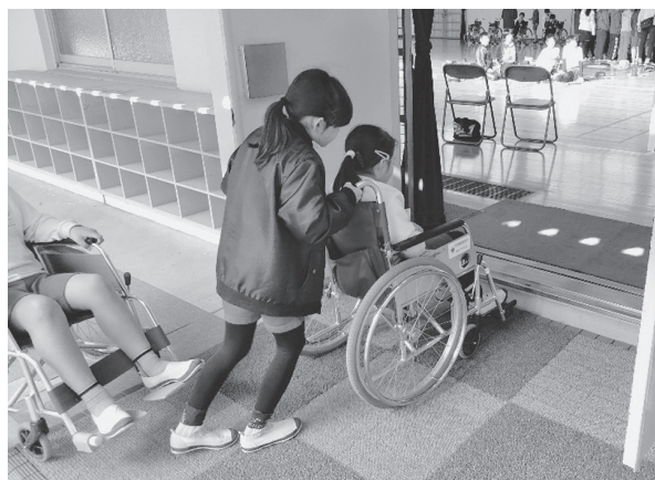
車いす体験を行っている児童の様子