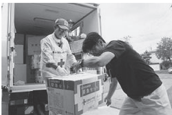
北海道胆振東部地震時の災害救護活動