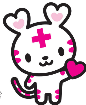
日本赤十字社公式キャラクター 「ハートラちゃん」