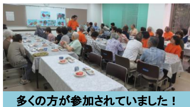
多くの方が参加されていました！

「上郷ゆうゆうクラブ」は、子どもから高齢者までの男女 28 人で活動しています。活動日は、第2火曜日に準備をし、第4火曜日を活動本番としています。活動内容は平成3年からふれあいを目的とした多世代交流をしており、27 年間活動しています。参加者全員が楽しむことができる余興、懐かしい歌声、見て楽しいものを企画するなど、準備段階からわいわいと賑やかに活動しています。