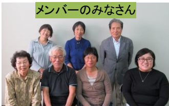
メンバーのみなさん

第1・3木曜日に崇化館交流館の子育てサロンにて絵本の読み聞かせを行ったり、小学校や高齢者施設にて読み聞かせボランティアを行っています。そのため、対象の方々は未就園児から高齢者の方々まで幅広いです。また、絵本の読み聞かせといっても聞いてもらう人は受身ではありません。一緒に読んだり、内容に合わせて身体を動かしたり、参加してもらうこともあります。高齢者施設では、歌を一緒にうたい、手遊びや、メンバーの特技を活かしたマジックなども行います。月に1回の定例会で読む本や活動内容をメンバーで考えるのも楽しい時間となっています。