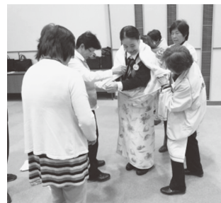
毛布を使ったガウン作りの様子

社協総務課（34-1131）にご連絡いただくか、豊田市生涯学習出前講座「お母さんから学ぶ防災知識」に登録していますので、そちらを通じてお申込みください。