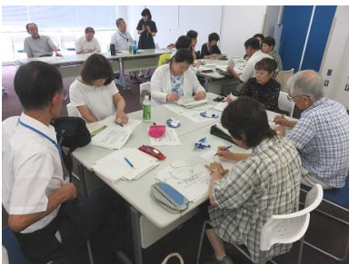
↑「とよた市民福祉大学」 グループワークの様子