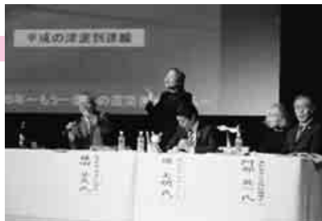
地域福祉計画・地域福祉活動計画周知事業 「東日本大震災から5年」要配慮者対策関連事業の様子