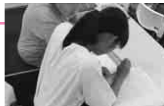
ボランティア体験隊「点字体験」の様子