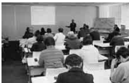
とよた市民福祉大学PR講座の様子

平成26年度に策定した「地域福祉活動計画(=安心して自分らしく生きられる、支え合いのまちづくり計画)」の実践2年目を迎え、地域住民の皆さまと関係機関との連携を強化して推進に取り組みます。