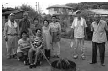
地域ふれあいサロンの様子