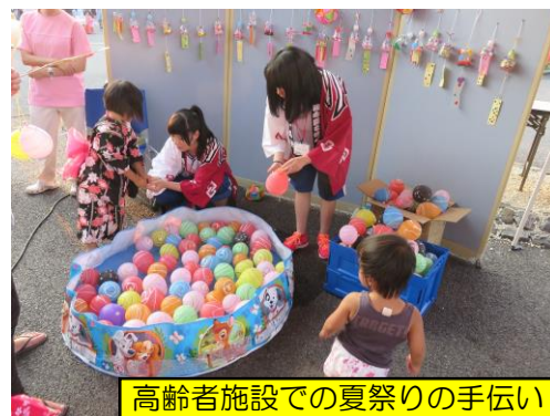
高齢者施設での夏祭りの手伝い