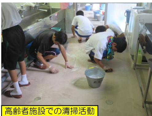
高齢者施設での清掃活動