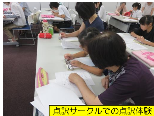
点訳サークルでの点訳体験