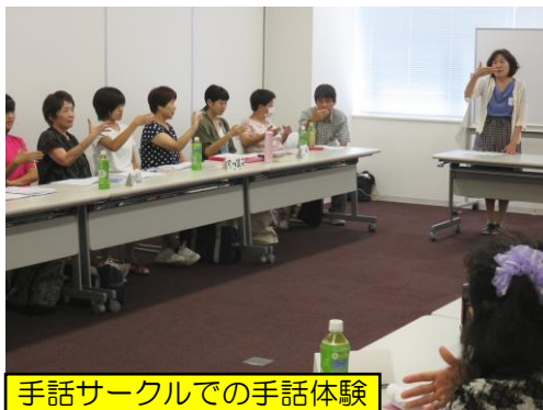
手話サークルでの手話体験

豊田市内の高齢者施設・障がい者施設・こども園等の福祉施設及びボランティア団体の皆様が用意して下さった 164 件のボランティア体験メニューに約 1,200 人の方が申し込み、ボランティア体験をしました。