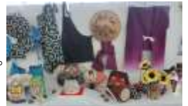
8月の「いしの梅一座」さんの作品展示の様子②