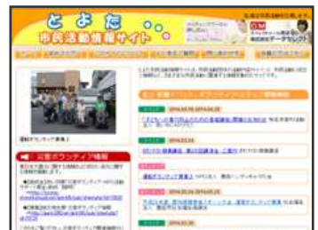
⑧とよた市民活動情報サイト ↓