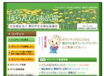
↑ ⑦とよたぼらんていあ広場