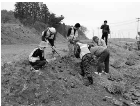
本会主催の東日本大震災被災者支援ボランティアバスによる活動